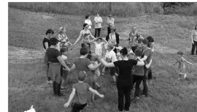
Dan šole na prostem