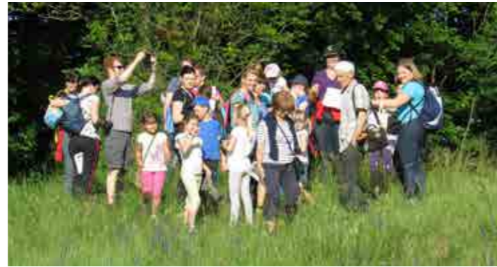
Malo drugačen dan šole v Stopercah