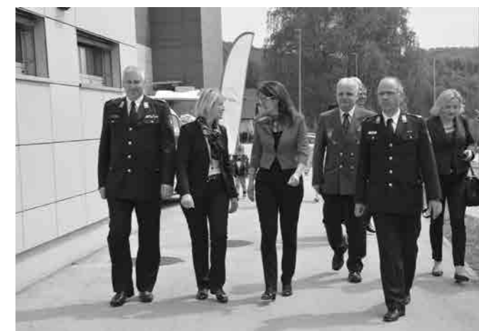
Ministrica na obisku

samo za sodobno zaščitno in reševalno opremo – največja prednost je v vsakem posamezniku, njegovi pripravljenosti, znanju in usposobljenosti. Poseben izziv pa predstavlja dejstvo, da je delovanje prostovoljstva v razmerah tržne ekonomije še posebej zahtevno. Prav zato ga še toliko bolj cenimo.« Posebej je izpostavila našo visoko stopnjo profesionalnosti in usposobljenosti ter dobro sodelovanje s poklicnimi gasilci, zaposlenimi v službah NMP, Upravi RS za zaščito in reševanje,