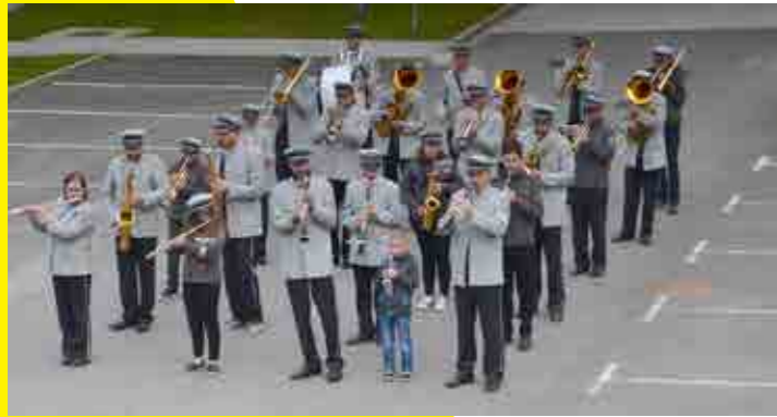
Prvomajska budnica DPO Talum Kidričevo