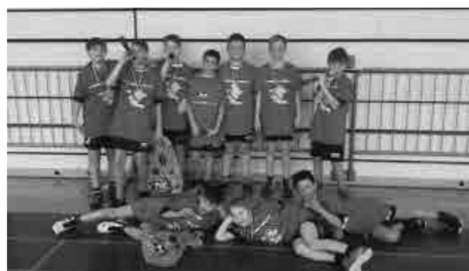
Tekmovanja v mini rokometu