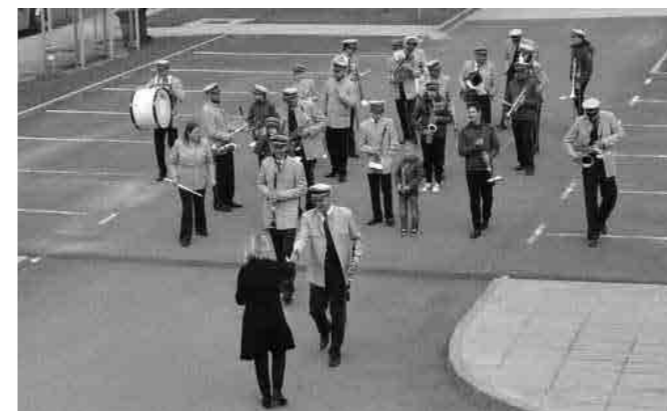
Pozdrav in zahvala županje za budnico