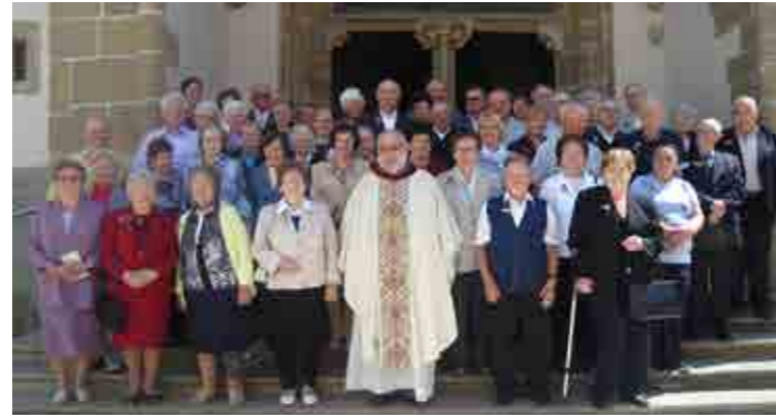
Zbrani starejši farani pred baziliko na Prujski Gori