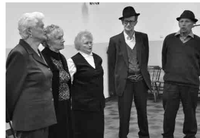
Med ljudskimi pevci