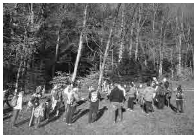
Pohod po učni poti Bojtina