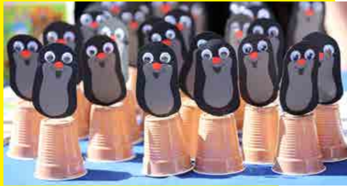
OŠ Majšperk je na dnevu Evrope na Ptujju predstavila Česko s pravljico Krtek