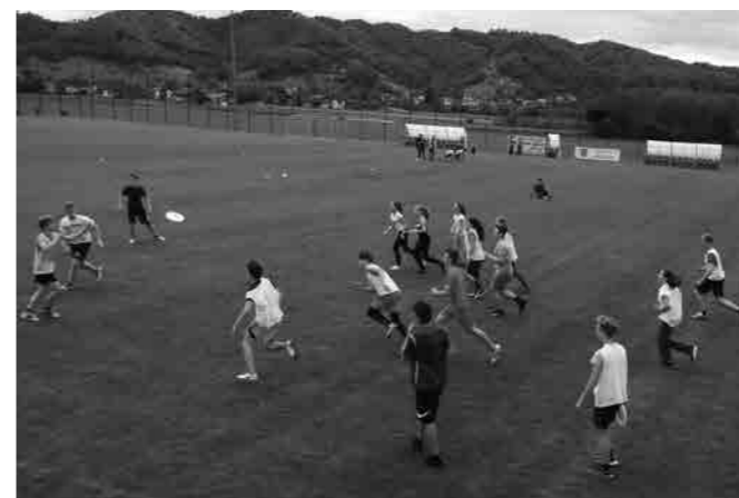
Predstavitve igre ultimate frizbi

Na športnem dnevu so nam igralci s Ptuja, ŠD Ptujška legija – ultimate Ptuj, predstavljali zanimivo igro ultimate frizbi in pozitivne strani, ki jih ta šport prinaša. Trudili so se predstaviti šport, ki je hkrati tudi zabava. Učenci so krepili svoje mišice tudi na napravah v fitnessu LEOFIT. V telovadnici so potekale različne športne igre.