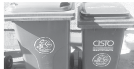
Tipski zabojnik za zbiranje biološko razgradljivih odpadkov