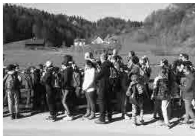
Pohod na Resevno