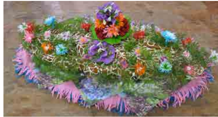
Pletenica Marije Bauman