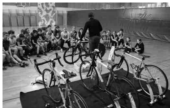
Predstavitve koles ...

Kolesarski klub Perutnina Ptuj je 14. 3. 2017 predstavil kolesarski šport. Predstavitve je potekala v telovadnici. V prvem delu je potekala predstavitve opreme, koles in tekmovanj. V drugem delu so se učenci pomerili v tekmih, ki je trajala dve minuti.