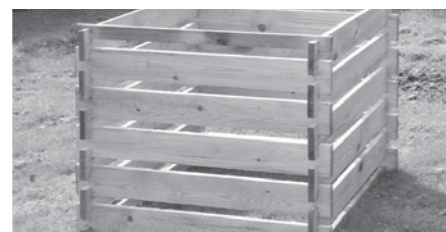
Kompostnik iz lesa