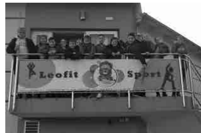
V fitnessu Leofit