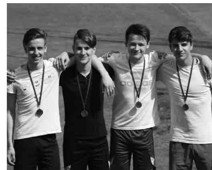
Štafeta 4 x 100 m, tretje mesto