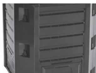
Kompostnik iz plastike