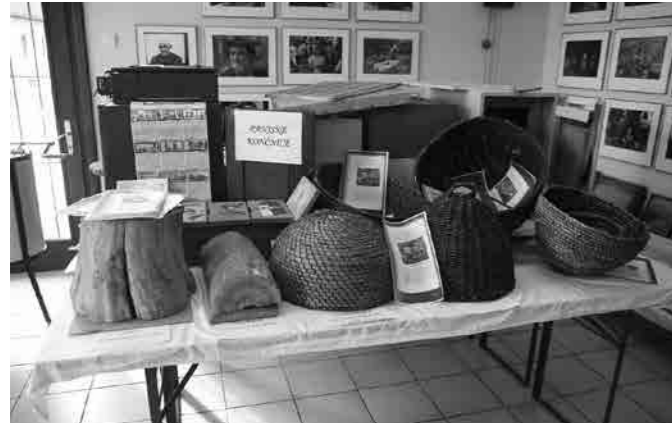
Čebelarstva razstava na Ptujski Gori

Razstava je bila odprta od 19. marca do 25. aprila in je bila dobro obiskana. Za vso pomoč in organizacijo ter samo pri-