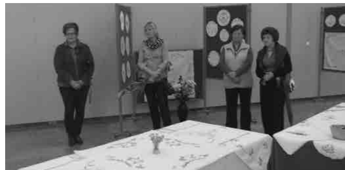
Ga. županja med govorom

vsemi prisotnimi je bilo zelo lepo pokramljati, se posladkati in tudi nazdraviti z dobro haloško kapljico. Hvala vsem, ki ste v dveh dneh prišli pogledat razstavo in upam, da ne bo zadnja, če mi bo zdravje služilo.