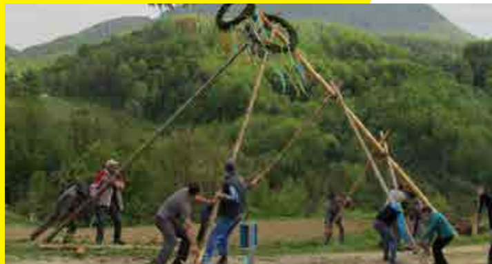
Postavljanje majskega drevesa na Kupčinjem Vrhu