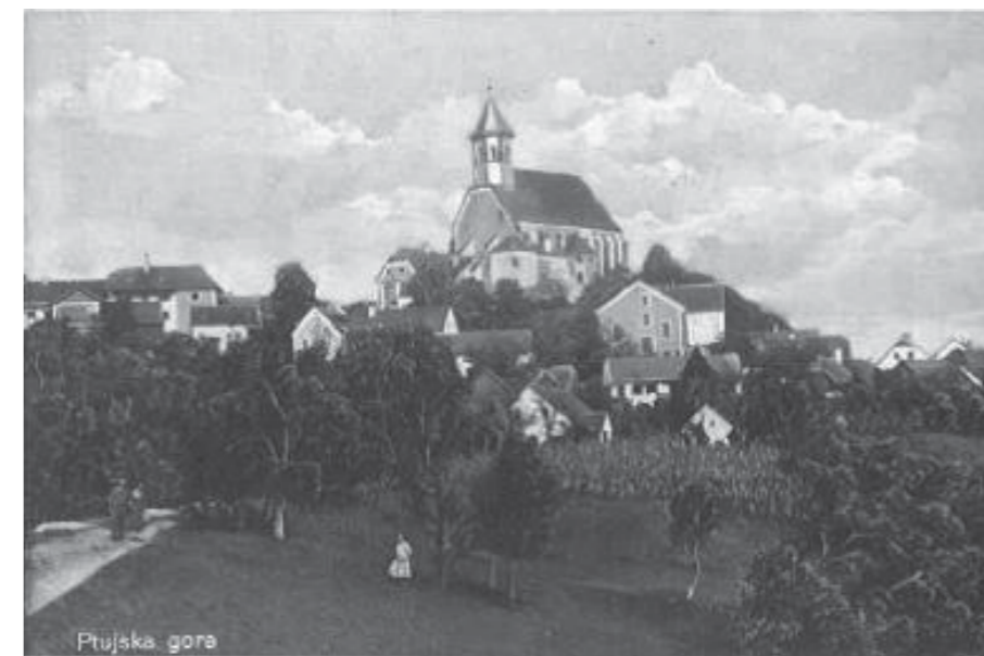
Razglednica Ptujške Gore

ki, pridigarji ali voditelji ljudskih pobožnosti. Ker se je v letih pred drugo svetovno vojno povečalo število članov minoritske province slovenske narodnosti, so lahko prevzeli nove postojanke in nudili še več pomoči duhovnikom po župnijah. Domačini s Ptujške Gore so brate minorite že poznali. Zato se je med njimi pojavila želja, da bi vodstvo župnije prevzeli prav oni.