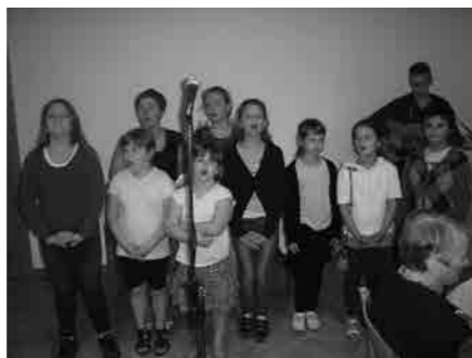
Starejše so s kulturnim programom razveselili otroci cerkvenega zbora na Ptujski Gori