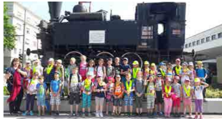
Na ekskurziji v Mariboru