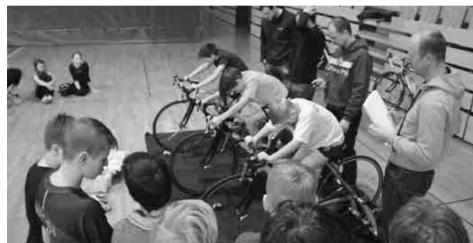
... in tekma