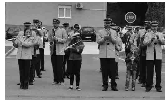
V prvomajsko jutro nas je zbudil Pihalni orkester Talum Kidričevo