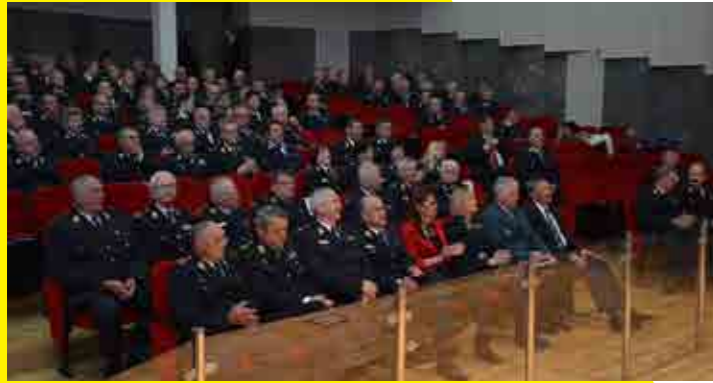
Plenum Gasilske zveze Slovenije